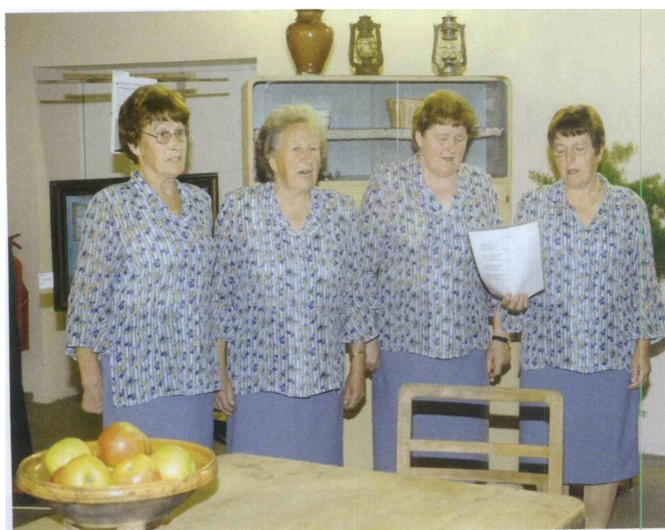
Stadkogorske ljudske pevke so zapele Hergouthovo pesem Trikrat na leto.