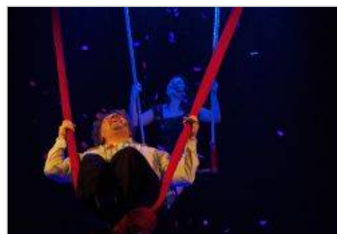
COMPAGNIA NANDO E MAILA