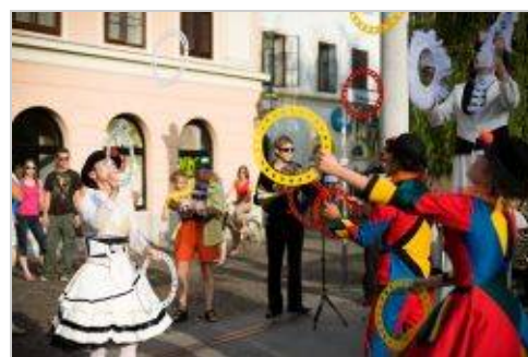
ZAVOD BUFETO

Več o dogajanju na: http://www.kcjt.si/sl/dogodki/2014-06-15/klovnbuf/1531