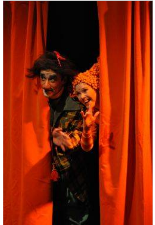
Zavod Bufeto