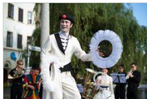
ZAVOD BUFETO