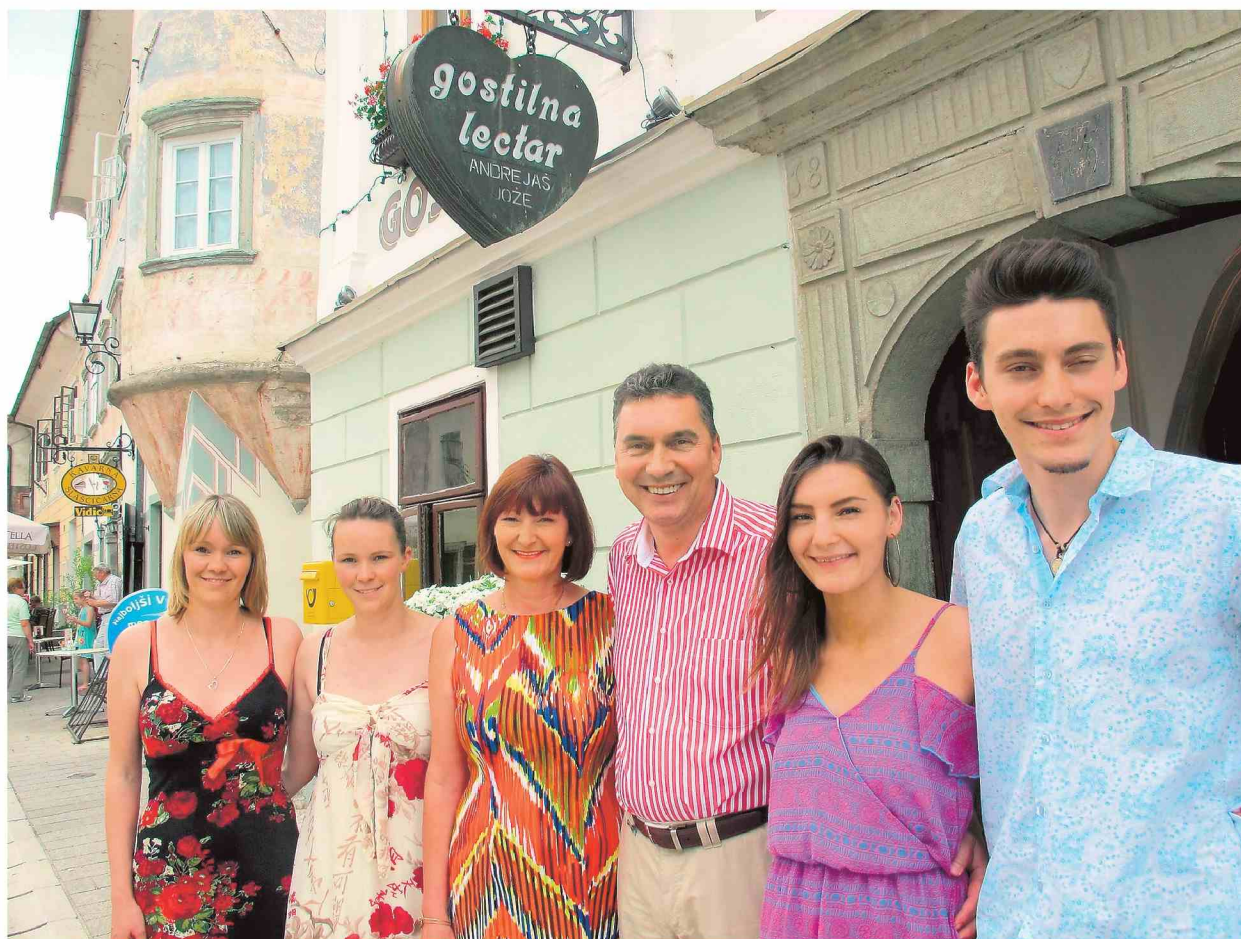
V družini Andrejaš ni prostora za slabo voljo, saj jo preženejo z glasbo in ljubeznijo do kulture. DRUZINA ANDREJAŠ IZ RADOVLJICE JE PREDANA LJUBITELJSKI KULTURI