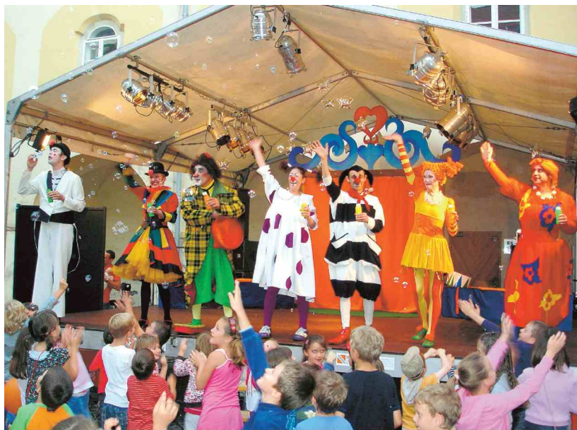
Klovnbufova festivalska karavana bo po Novem mestu obiskala še Mursko Soboto, Izolo, Slovenj Gradec in Celje.