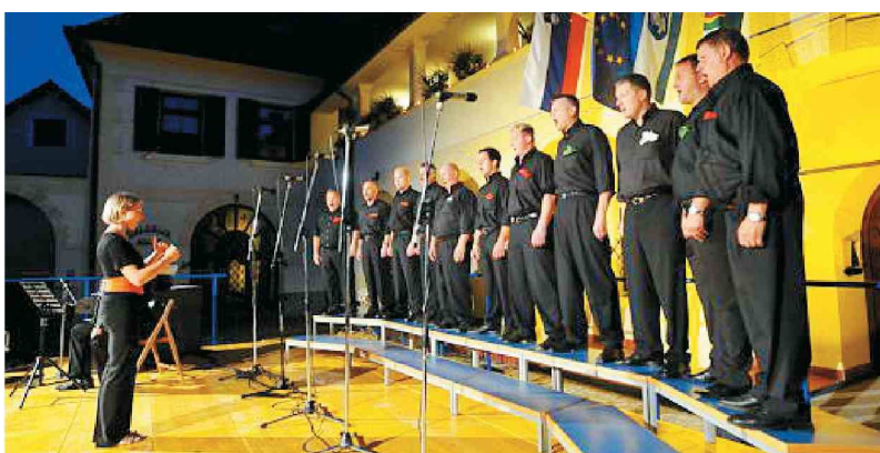
Moški pevski zbor Adoramus je ambiciozen in predan, letos bo spet zapel na Slovaškem.

Člane zbora Adoramus povezujejo ljubezen in veselje ter volja do petja in napredovanja na tem priljubljenem področju amaterske kulture. Radi se pridružijo tudi skupnim projektom, eden večjih je bil ob 800. obletnici