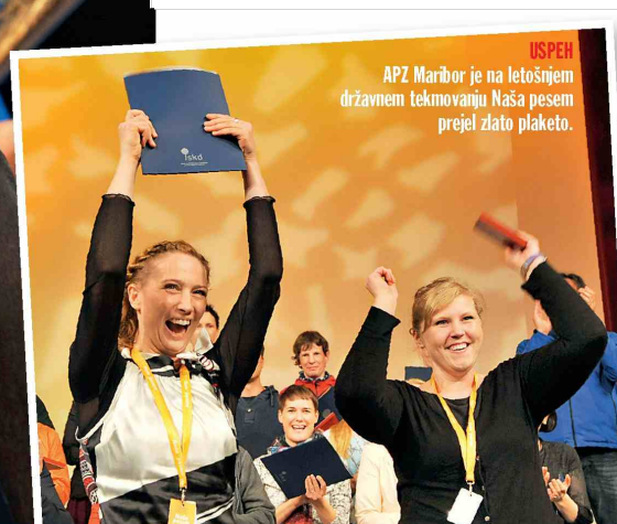
USPEH APZ Maribor je na letošnjem državnem tekmovanju Naša pesem prejel zlato plaketo.