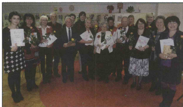
Udeleženke in udeleženci literarne ustvarjalnice