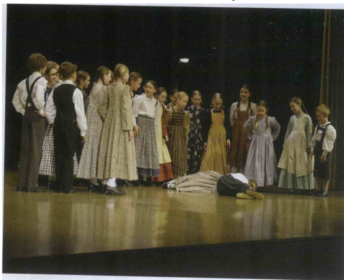
Pa vse pesmice so preč.