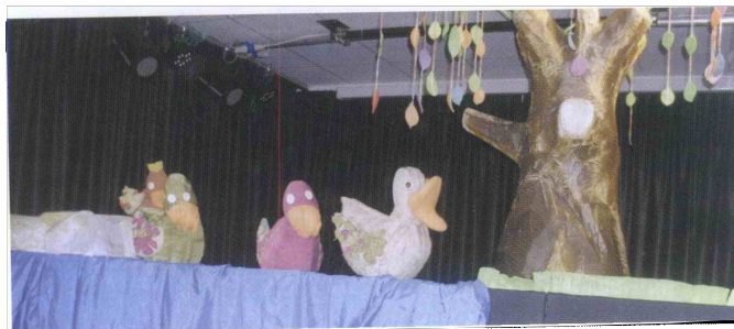
Otroci so zamaknjeno zrlji na lutkovni oder, občudovali račke in jim prisluhnili.

bo v sredo, 23. aprila. Uprizoritev so omogočili Mestna občina Celje, Zavod Celeia, JSKD in Zveza kulturnih društev Celje. (LC)