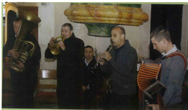
Murnovi godci so igrali na več kot sto let starih instrumentih. (zgoraj) Fantje iz Selške doline so prepoznavni po šestglasnem petju. (spodaj)