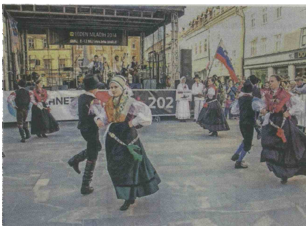
Glavni trg v Kranju so v petek zasedle mlade folklorne skupine.