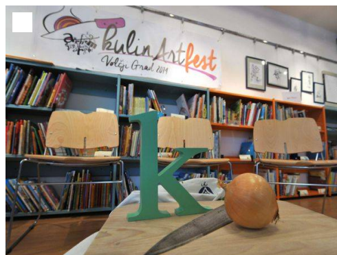
Pred predstavitvijo v Narodnem domu (FOTODAM.J@N)