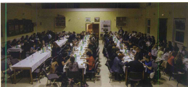
Po koncu prelepe prireditve, polne glasbe in prijetnega prijateljskega druženja, je sledila pogostitev, ki so se je udeležili vsi gostujoči zbori in ostali