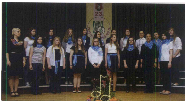
Dekliški cerkveni pevski zbor La vita sestavlja 25 deklet, njihova avtorska pesem Svetogorski pa je bila izbrana celo za najlepšo Marijino pesem v letu 2013.