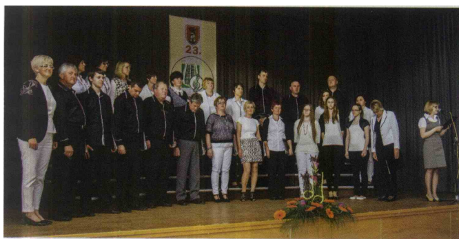
Cerkveni mešani pevski zbor Kulturnega društva Zvon iz Podčetrčka označujejo vrline, kot so prijateljstvo, povezanost, vztrajnost, predvsem pa velika ljubezen do slovenske pesmi.