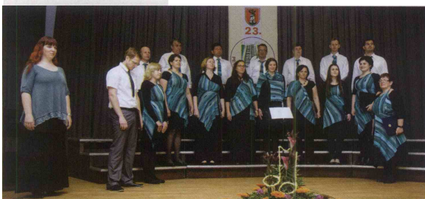
Mešanemu pevskemu zboru Bistrica ob Sotli, kjer prepevajo pevci različnih starosti, bodo ljubitelji zborovskega petja lahko prisluhnili junija, na koncertu, ki ga pripravljajo skupaj z MoPZ Terme Olimia, in na Svetih gorah, kjer organizirajo celovečerni koncert.