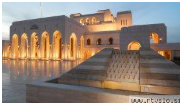
Veličastna operna hiša v Muškati.

V tej palači umetnosti gostujejo le najboljši operni ansambli, orkestri in solisti z vsega sveta, ne glede na ceno, poglavitno merilo je vrhunska kakovost. Poleg operno-baletnih predstav je tukaj mogoče poslušati