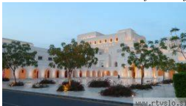
Skoraj tri leta stara operno-koncertna hiša je prava paša za oči.