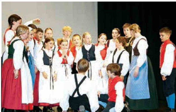
Otroške folklorne skupine so ponudile prgišče dediščine, vedrine in tudi zabave.