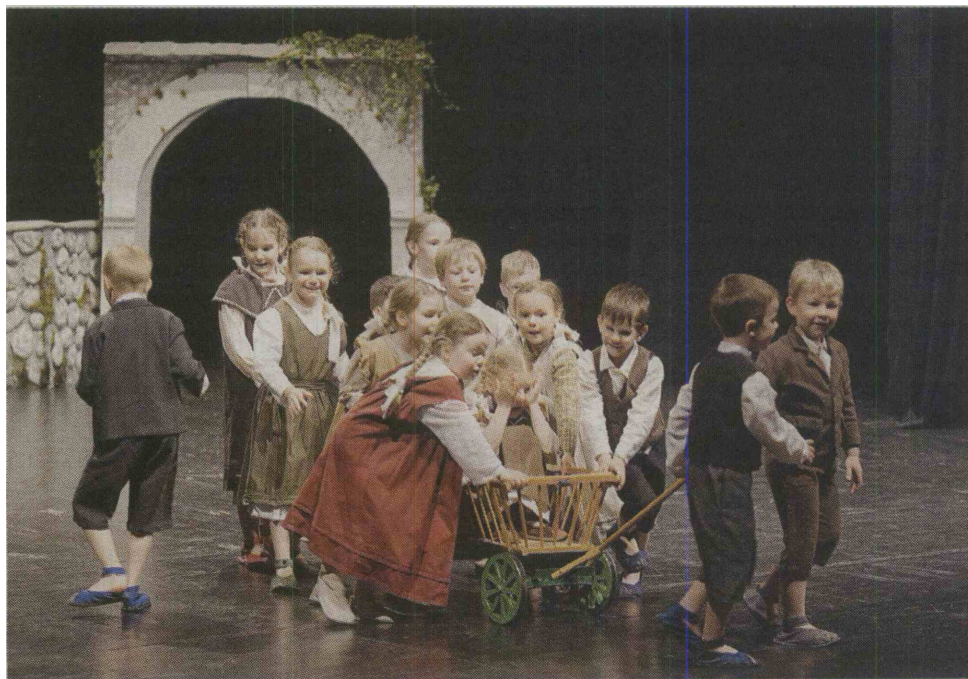
V Otroški folklorni skupini Kamenčki se je izmenjalo že 20 generacij malčkov iz vrtca

"Letos jih je kar 35, medtem ko jih je bilo prejšnja leta do 20. Stari so med štiri in šest let, srečujemo pa se enkrat tedensko," je povedala Štrukljeva, ki je za 20 let dela v okviru Javnega sklada za kulturne dejavnosti prejela najvišje priznanje za področje folklorne dejavnosti - Maroltovo plaketo.