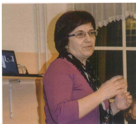
Ravnateljica je izrazila dobrodošlico v prostorih OŠ Lesično.