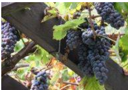
Rez kamniške potomke najstarejše vinske trte (10. marec 2014).