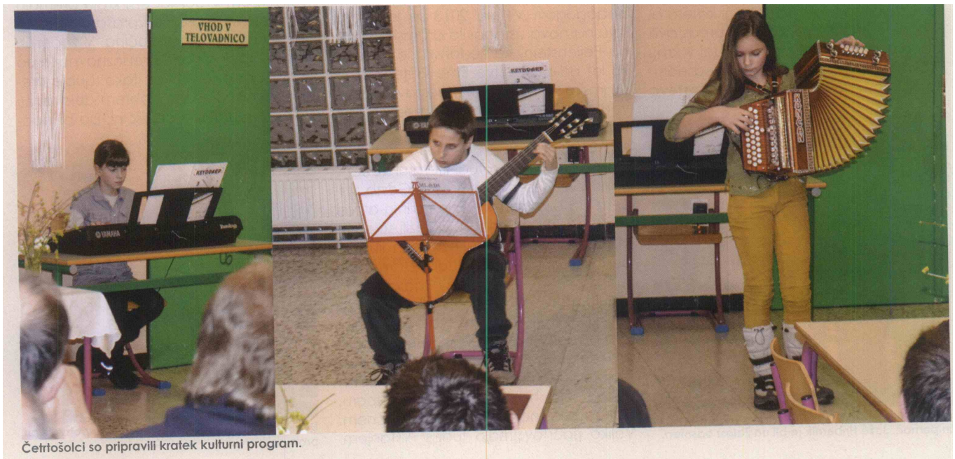
Četrtošolci so pripravili kratek kulturni program.