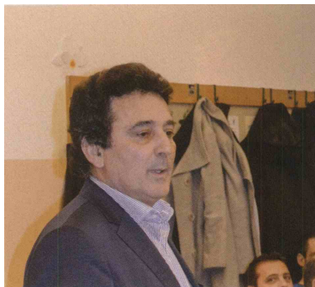
Župan je poudaril, da se mora turizem bolj razvijati.