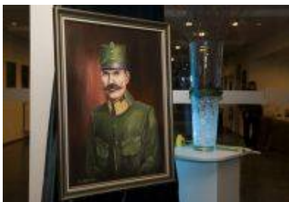
V mesecu marcu bodo v Kamniku počastili rojaka Rudolfa Maistra-Vojanova.