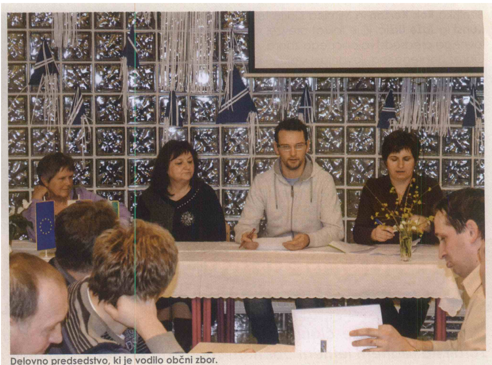
Delovno predsedstvo, ki je vodilo občni zbor.