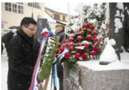
28. marca 2014 bodo položili venec ob 140-letnici rojstva Rudolfa Maistra.