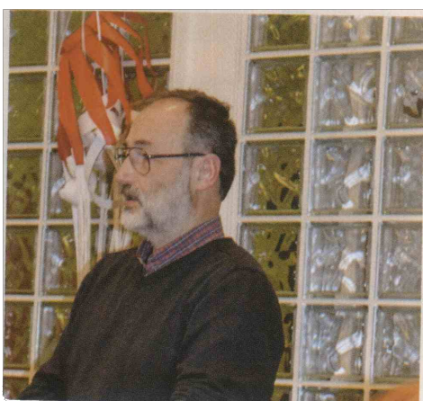
Direktor Kozjanskega parka je društvo pohvalil pri promociji.