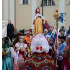
Rusko pustovanje na Pogačarjevem trgu v