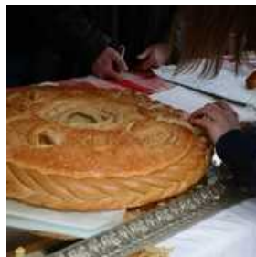
Rusko pustovanje na Pogačarjevem trgu v