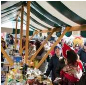
Rusko pustovanje na Pogačarjevem trgu v