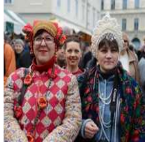
Rusko pustovanje na Pogačarjevem trgu v