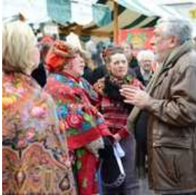
Rusko pustovanje na Pogačarjevem trgu v