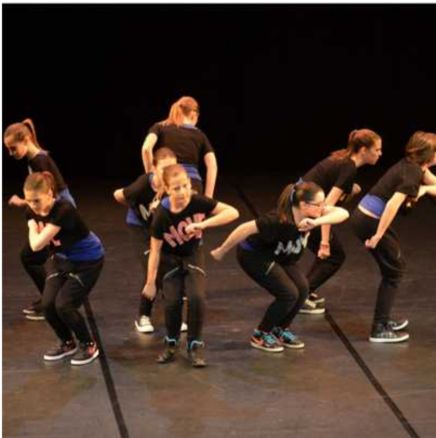
Plesalci iz skupine Arturtrip so izvedli koreografijo pravega naslova Move.

Dance World Cup 2014. Izbirno tekmovanje Slovenije je končano