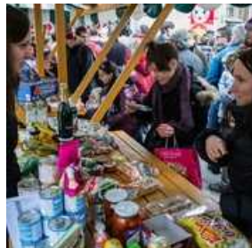
Rusko pustovanje na Pogačarjevem trgu v