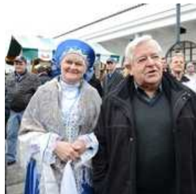
Rusko pustovanje na Pogačarjevem trgu v