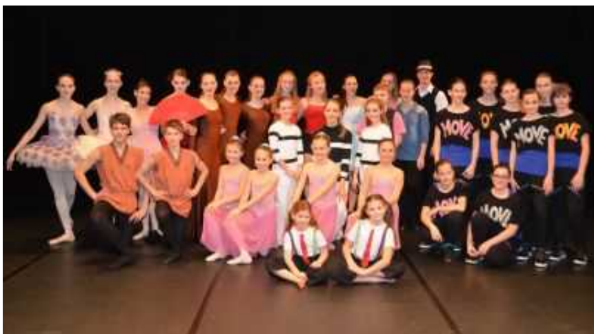
Plesalci šestih plesnih in baletnih šol so se zbrali na odru Prešernovega gledališča v Kranju.

Leto je naokoli, in tako je 16. februarja znova steklo izborno tekmovanje za Slovenske mlade plesalce, in najboljši se lahko udeležijo finalnega mednarodnega tekmovanja Dance World Cup / DWC 2014 v času od 29. junija do 6. julija na Portugalskem.