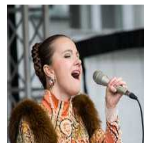
Rusko pustovanje na Pogačarjevem trgu v