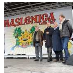
Rusko pustovanje na Pogačarjevem trgu v