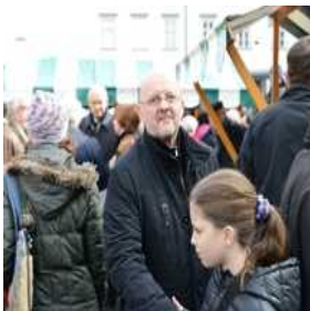
Rusko pustovanje na Pogačarjevem trgu v