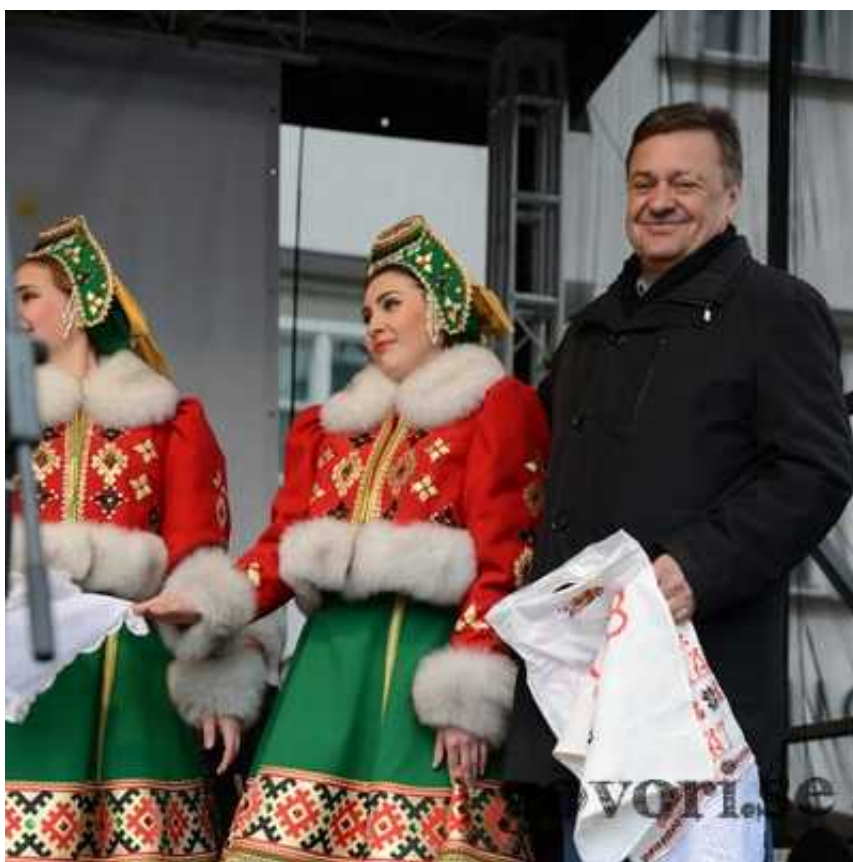
Rusko pustovanje na Pogačarjevem trgu v Ljubljani

V Ljubljani so se od zime poslovili v ruskem slogu. Zaradi ujemanja koledarjev sta letos hkrati potekala slovenski pust in ruska maslenica.