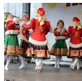
Rusko pustovanje na Pogačarjevem trgu v