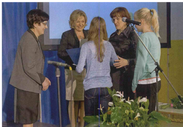
Devet kulturnih društev je prejelo priznanja JSKD za udeležbo na regijskih in državnih tekmovanjih.

Izrazila je strah pred podiranjem vrednot, ki smo jih gradili skozi