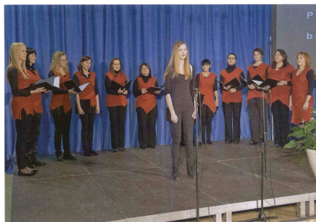
Glasovirke so predstavile moderno kantato avtorja Damijana Močnika.

stoletja. Za to je okrivila številne medije, ki s »prikazovanjem nestrpnosti in nasilja podirajo meje medsebojnega sožitja in tudi sami postajajo nasilni, ne da se tega sploh zavedajo.« Zato je pozvala, da nas takšen način komunikaci-