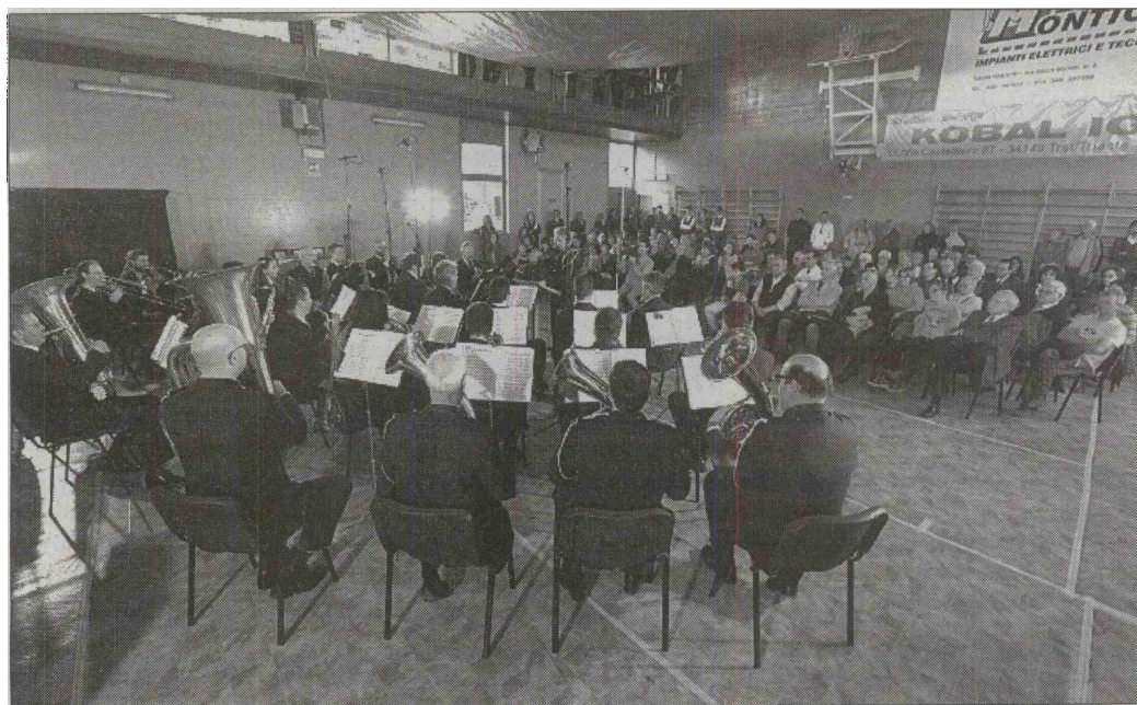
Nastop članov Godbenega društva Nabrežina