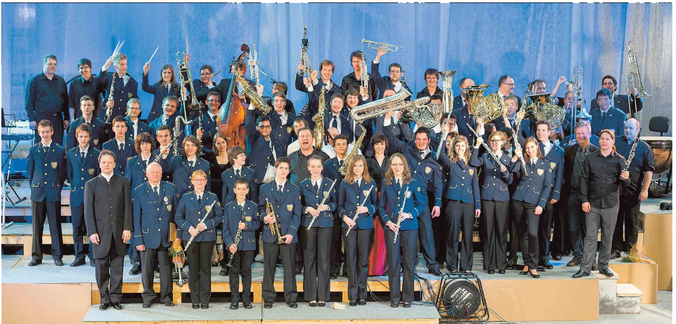
Pihalni orkester Logatec z nocojšnjim literarno-glasbenim večerom končuje svoja praznovanja ob stoti obletnici delovanja.