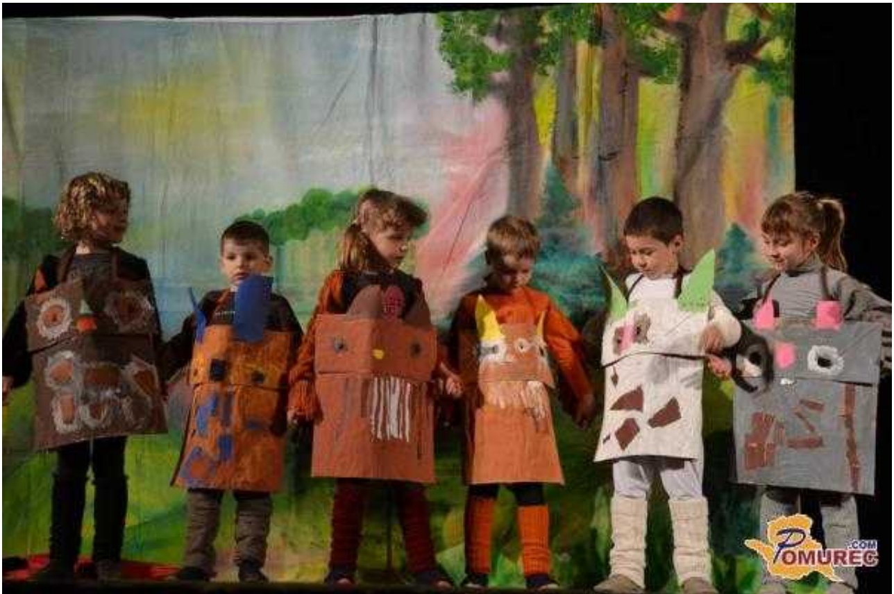
Dogodek so obiskali okoliški vrtci in šole, ter uživali v lutkovnih predstavah.