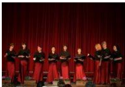
Ženski nonet Vigred.