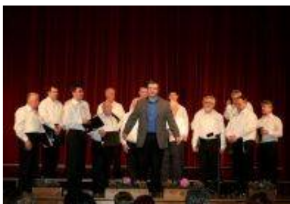
Moški zbor Lipa Trojane.