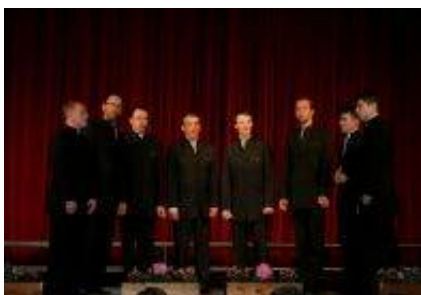
Kulturno društvo Grajski oktet.