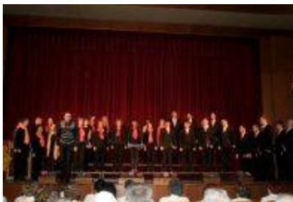
Pevsko društvo Mešani pevski zbor Klas Groblje.