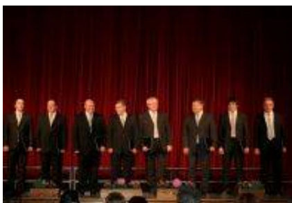
Moški komorni zbor Mengeški Zvon.