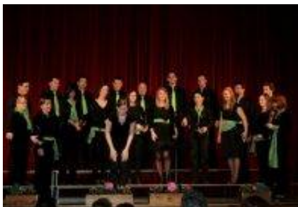
Mešani pevski zbor Hippiemus.