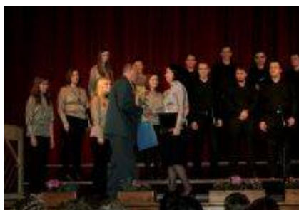
Na prvem koncertu je nastopilo enajst zborov.