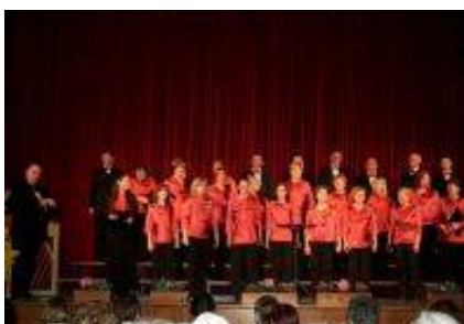
Mešani pevski zbor Svoboda Mengeš.