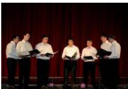
Oktet Mi (podmladek MokZ Mengeški Zvon).