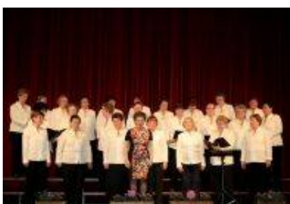
Ženski pevski zbor Stane Habe DU Domžale.