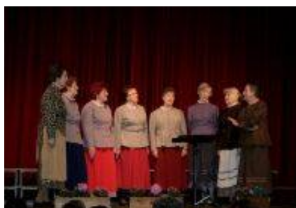
Ljudske pevke KD Domžale.