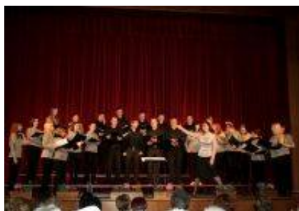
Mešani pevski zbor Slanik Ihan.