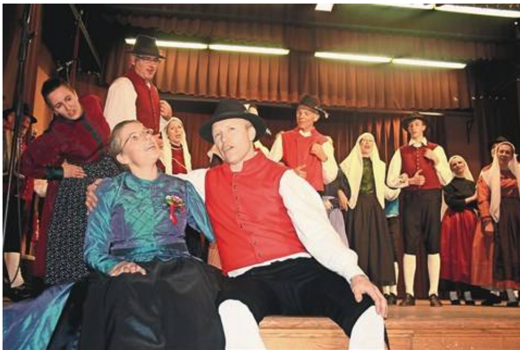
Ptički za ptičke - folklorna skupina Gartrož iz Nove Gorice

Devet folklornih in prav toliko pevskih skupin je v soboto v Tolminu, v nedeljo pa v Spodnji Idriji v organizaciji tamkajšnjih izpostav JSKD občinstvo popeljalo med ljudske plesе, pesmi in glasbo minulih časov. Folklorne skupine bodo tudi ocenjene.