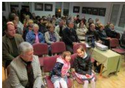
Občinstvo na odprtju razstave.