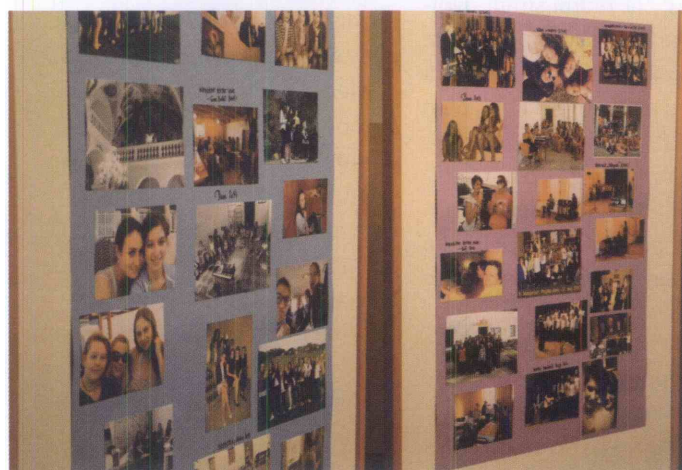
Desetletje pevske poti so občinstvu predstavile tudi skozi fotografije.