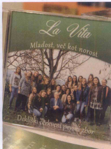
Ob jubileju so uresničile željo in uspele posneti prvo zgoščenko.