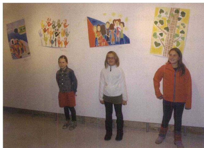
Tako učenci in učenke iz osnovnih šol šentjurske in dobjsanske občine vidijo domovino, svobodo, pogum.