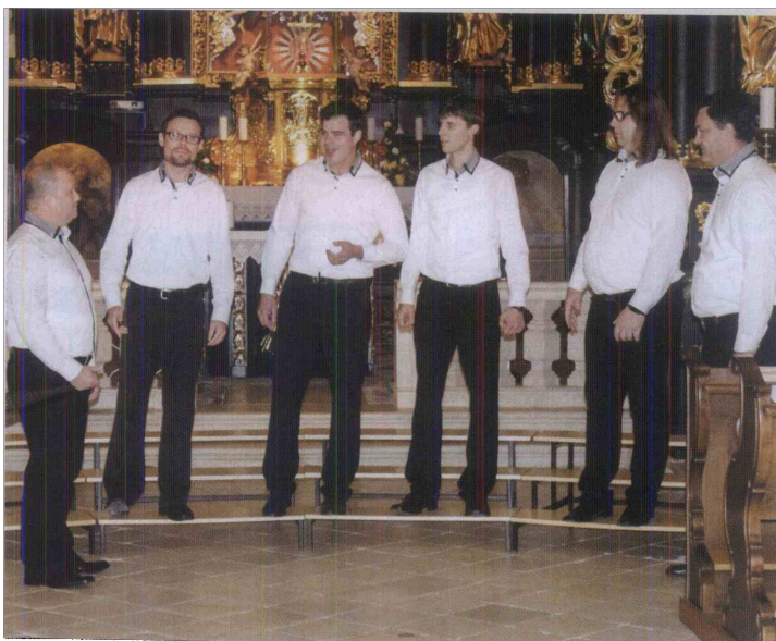
Dravograjski sekstet je svoj glasbeni izbor nastovil »Naj me koklja brčne, pa sem res petelin«.