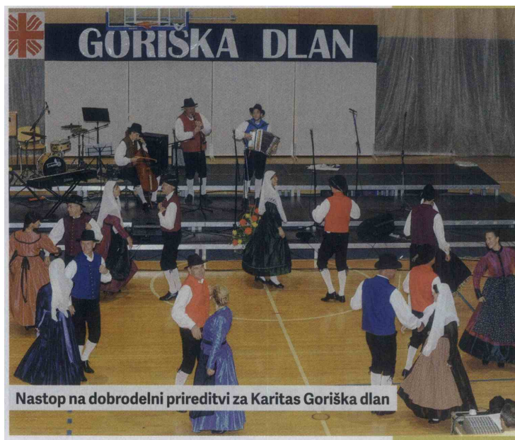
Nastop na dobrodelni prireditvi za Karitas Goriška dlan

Glede na to, da živimo tik ob meji, nas razen občasnih povabil na krajše nastope in festival Mitteleuropa v Italiji, ne veže kaj dosti. Morebiti je temu ovira v jeziku ali pa sami organizaciji nastopov. Kolikor smo seznanjeni, v sosednji Italiji – v okolici Gorice, ni slovenske folklorne skupine. Lepo bi bilo slišati o sodelovanju, morda pa je vse to še pred nami. Kadar odrska postavitve vsebuje tudi igrane vložke, je najlepša naša improvizacija, saj nikoli ne vemo, kaj bo nastalo. Vsak nastop zna biti unikaten, vsak dialog drugačen in zanimiv in neponovljiv tudi za nas, nastopajoče.