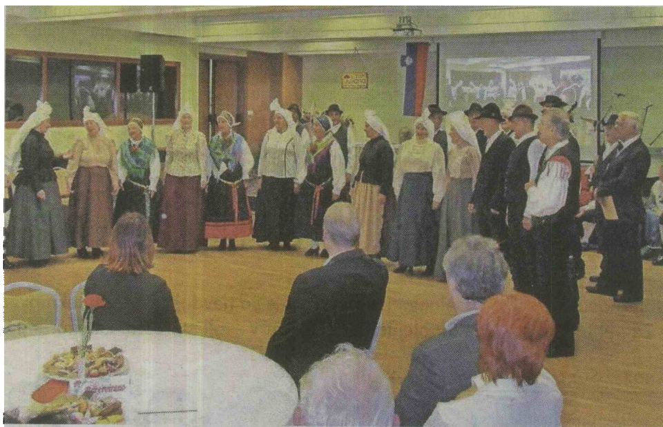
Juliana je dvajsetletnico delovanja počastila z nastopom v Kranjski Gori.