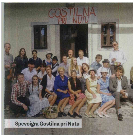
Spevoigra Gostilna pri Nutu

fanta: Ludvik in Štefan. Žal pa se je Ludvik pridružil fašistom, iz česar nastane vrsta zapletov in težav. Hudomušna spevoigra, ki vključuje ples, petje, igro ter godčevske vložke, je bila izredno dobro sprejeta, premierno so jo prikazali ob prazniku sv. Petra in Pavla v Šempetru pri Gorici v prekrasnem župnijskem ambientu.