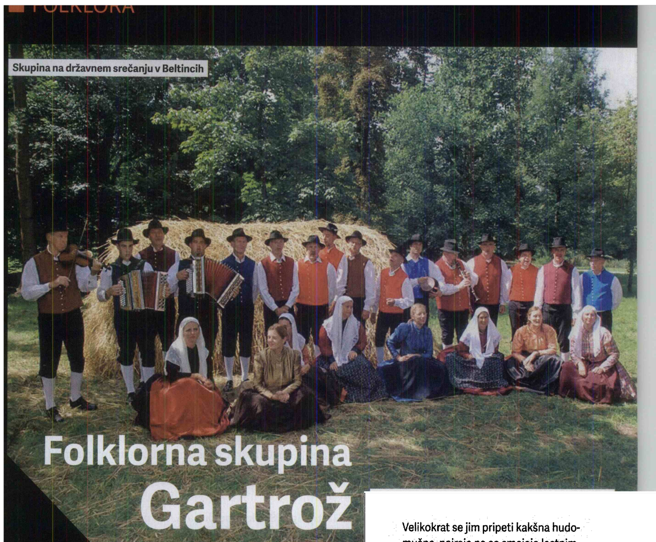
Skupina na državnem srečanju v Beltincih