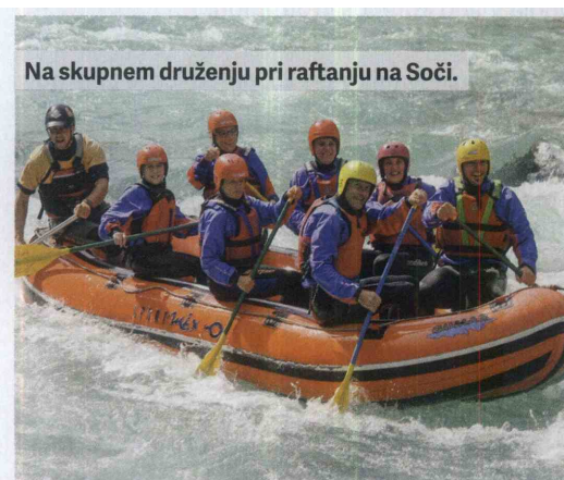
Na skupnem druženju pri raftanju na Soči.

Aljoša Rehar aljoša.rehar@sva.gov.si