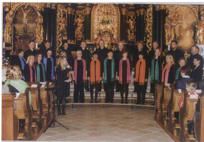
Z venčkom ljudskih iz Slovenske Istre so Sozvočenja 2014 otvorili člani Mešanega komornega zbora Celje.