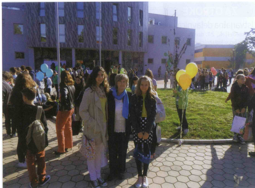
Učenci z mentorico.