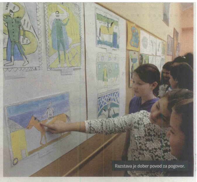
Razstava je dober povod za pogovor.