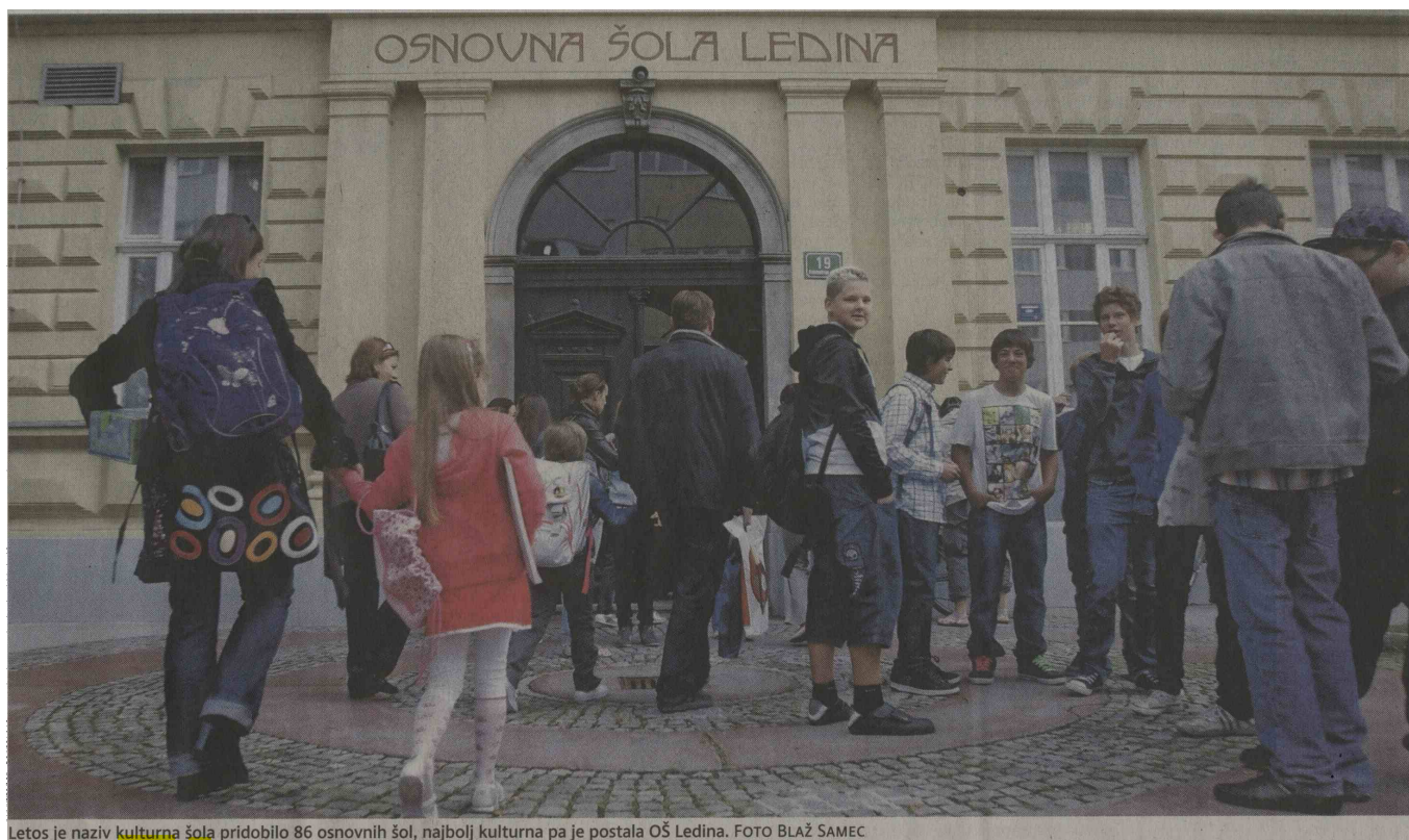
Letos je naziv kulturna šola pridobilo 86 osnovnih šol, najbolj kulturna pa je postala OŠ Ledina.