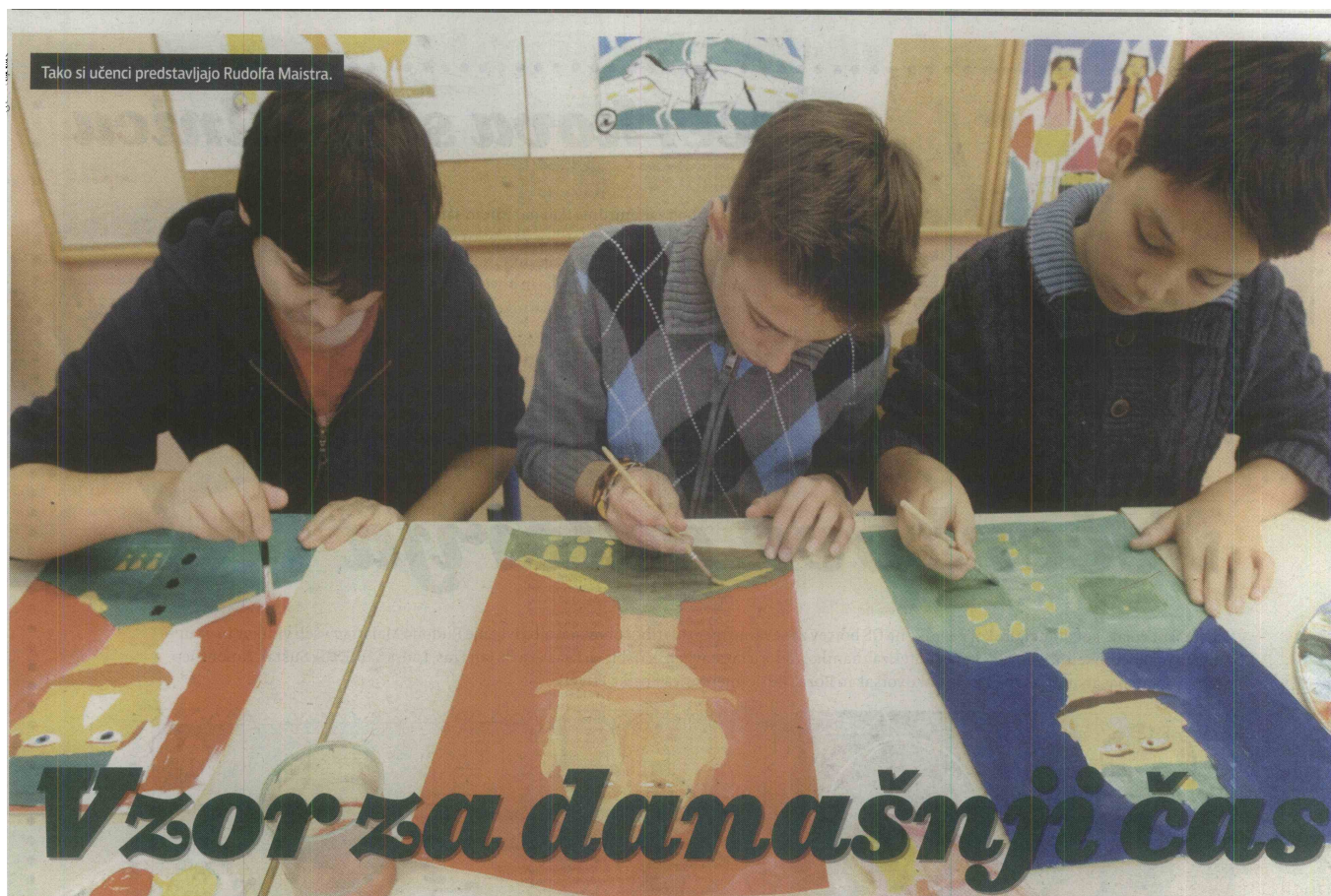
Tako si učenci predstavljajo Rudolfa Maistra.