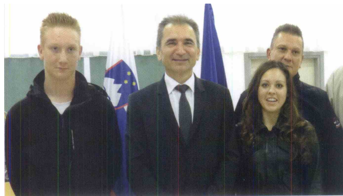
Obrambni minister Janko Veber z Rozmanovim vnukom Boštjanom in pravnukoma Kristjanom in Taro

Besedilo in fotografije: Jožica Hribar, Bogdan Perko