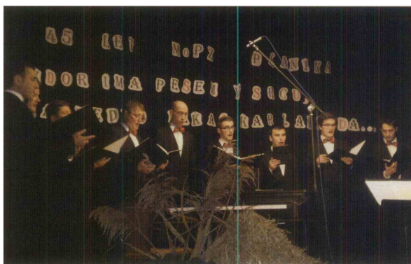
V zadnjem letu se je zboru pridružilo nekaj novih članov, zato se ni bati, da bi jih ne obiskal Abraham