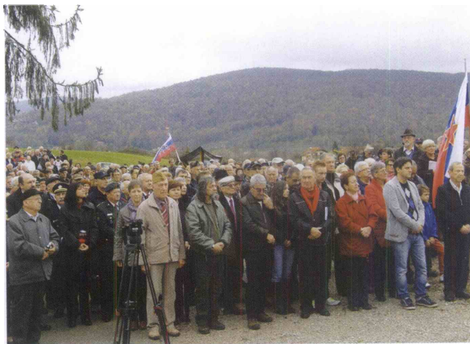
Slovesnost v Lokvah pri Črnomlju

Na osrednji spominski slovesnosti, ki je v organizaciji ZB za vrednote