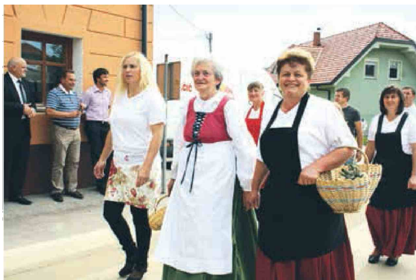
Tavžentrože so nepogrešljive na vseh prireditvah v kraju.