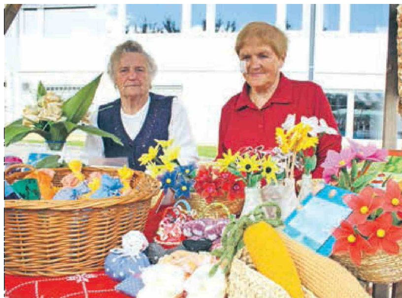
Korenje vseh vrst in iz različnih materialov so predstavljale upokojenke.