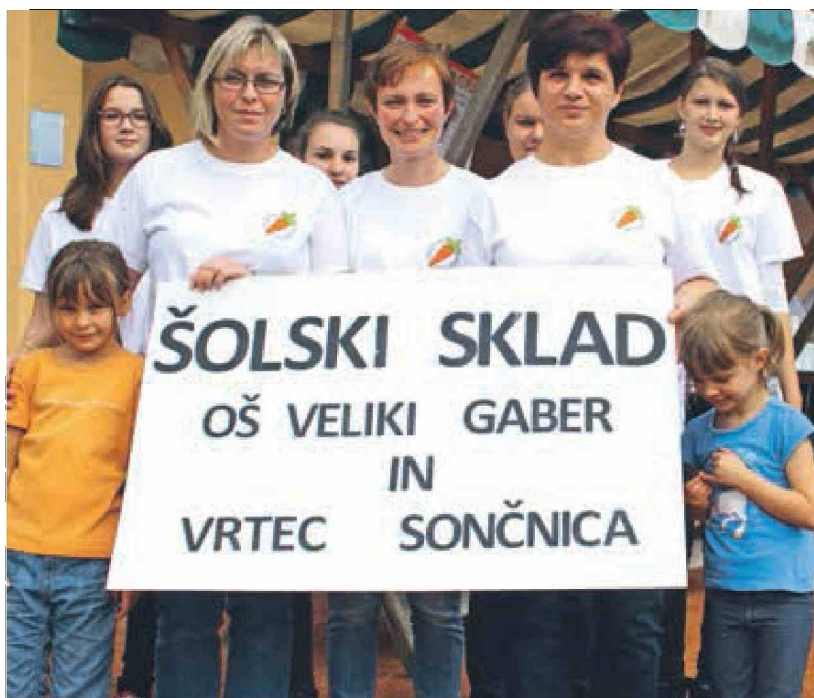
OŠ Veliki Gaber je zbirala denar za šolski sklad, prispevala je tudi program.