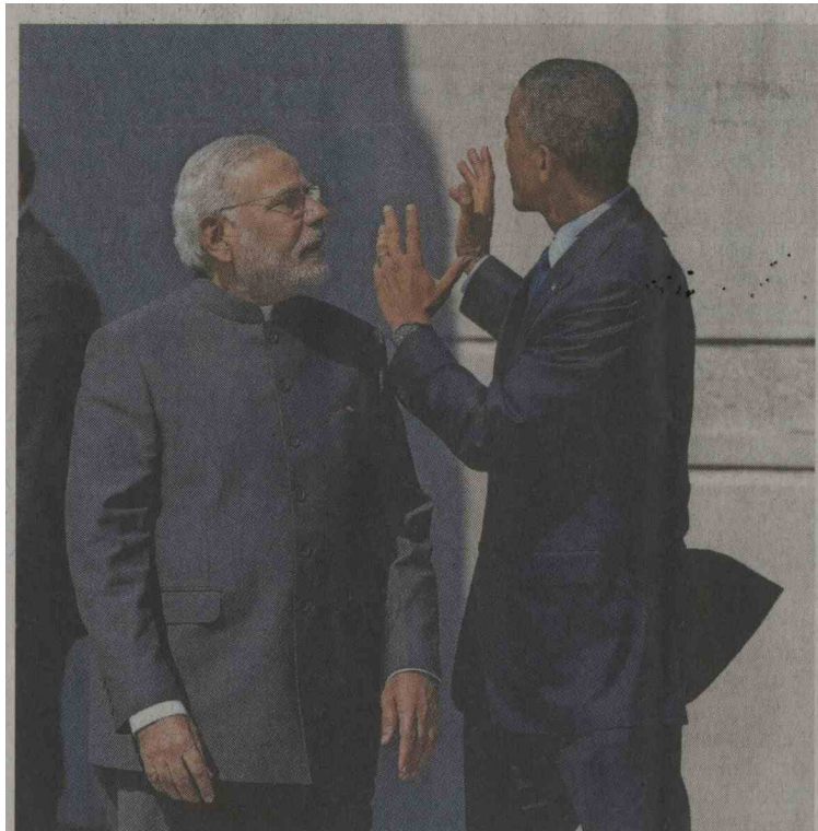
Narendra Modi in Barack Obama