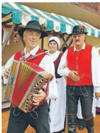
S harmoniko so na prizorišče prišli upokojenci.