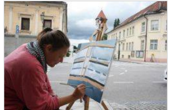
Bogata brežiška likovna ustvarjalnost. Fotografija je z nedavne enodnevne kolonije brežiške območne izpostave javnega sklada za kulturne dejavnosti .

Društvo likovnikov Brežice se pogosto pojavlja na lokalnem likovnem prizorišču z likovnimi kolonijami in z razstavami.