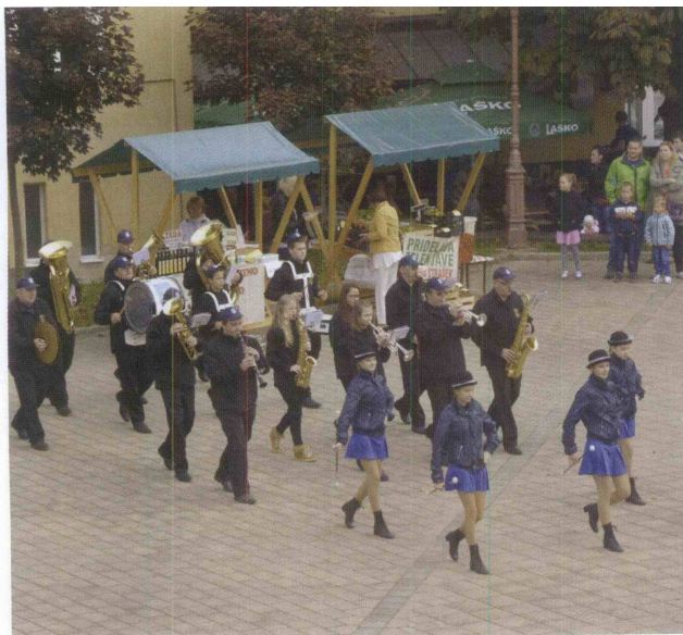
Nastop godbenikov z Vrha nad Laškim popestrijo mažoretke.

nastop vseh petih godb, ki so združene odigrale štiri znane slovenske melodije.