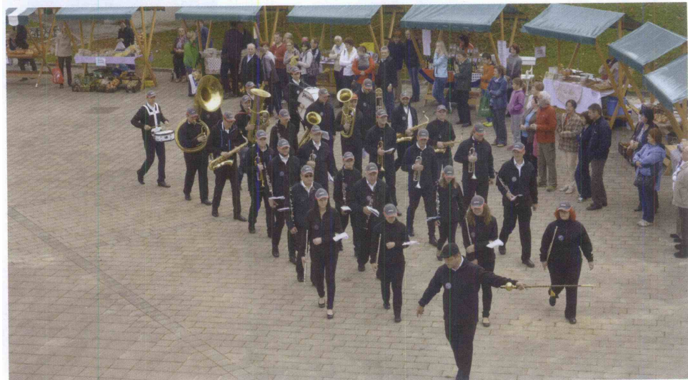
Domači pihalni orkester, ki je organiziral srečanje.

godba na pihala, ki je predstavila koreografijo s korakanjem (»popodobno« so se priklonili občin-