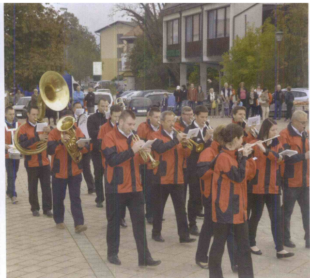
V Šmarju so nastopili tudi prvi sosede iz Rogaške Slatine.