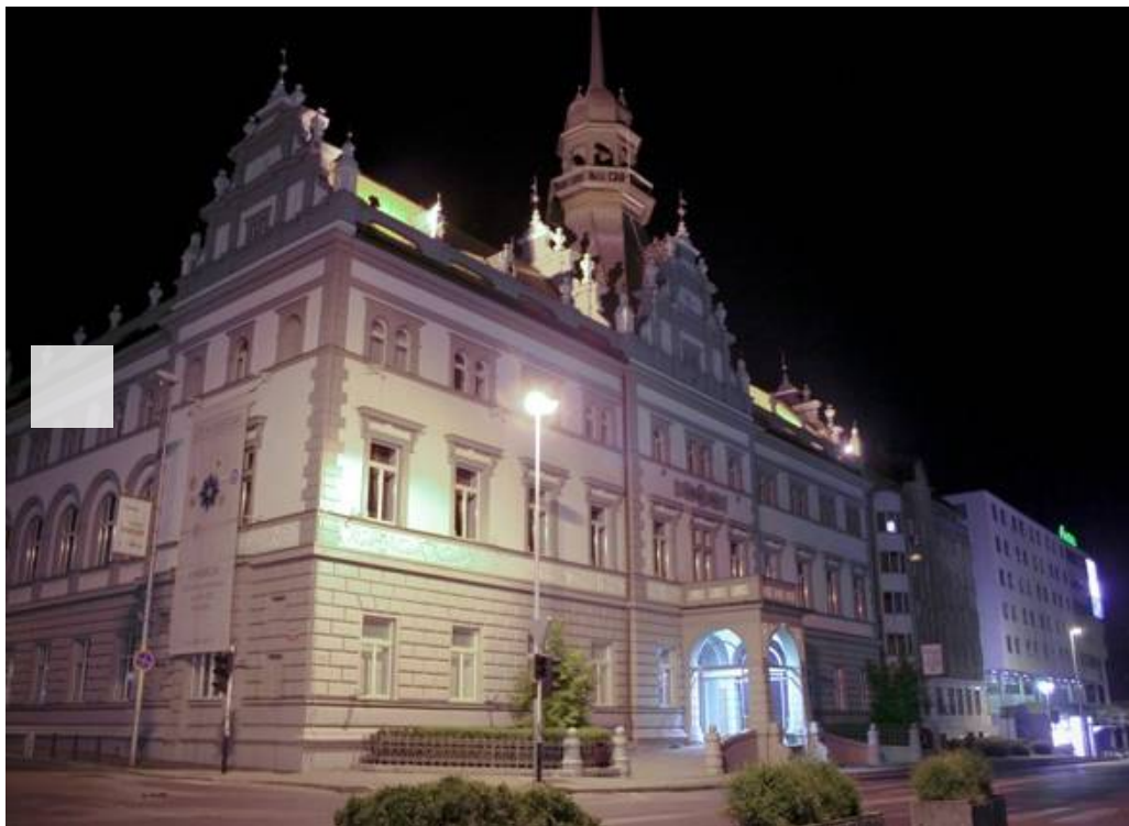
PONEDELJEK, 20. OKTOBER 2014 - NARODNI DOM MARIBOR