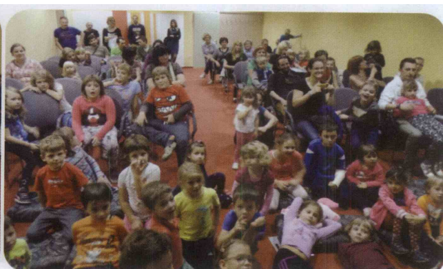
Odličen obisk ob otvoritvi 5. sezone Ježkovega nahrbtnika.