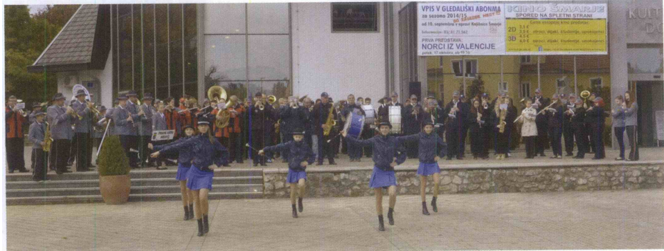
Godbe na pihala so polepšale sobotno dopoldne v Šmarju.