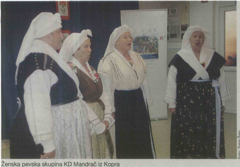
Ženska pevška skupina KD Mandrač iz Kopra