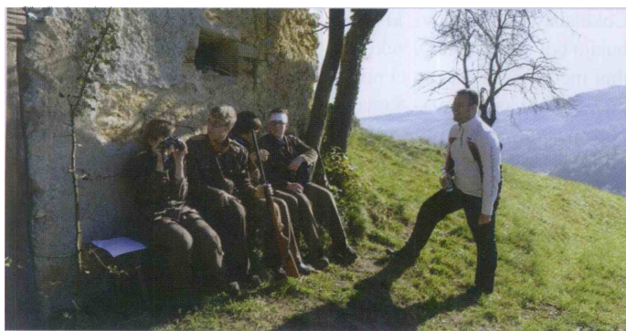
Uisklajevanje pred snemanjem prizorov je potekalo v sproščenem in nasmejanem vzdušju.