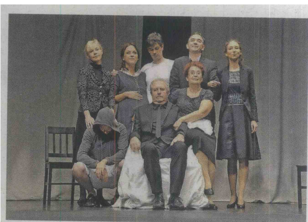
Na Loškem odru igra najboljša ljubiteljska skupina v državi. Zmagovalni ansambel predstave Igre je konec.

Po več letih brez komedije so se na Loškem odru letos ponovno odločili za ta med gledalstvom zelo ljub gledališki žanr. Angažirali so mladega režiserja Milana Goloba, sicer novince na Loškem odru, izbrali pa so znano Feydeaujevo komedijo Maček v žaklju. Zgodba pripoveduje o premožnem pariškem malomeščanu, ki se odloči, da njegovi pomembnosti manjka le še premiera njegove opere – Faust (ki jo je sicer napisala njegova hčerka). Velik ljubitelj opere svojega prijatelja prosi, naj zanj angažira znamenitega tenorista iz Bordeauxa, a namesto tega v bogatašvo družino vstopi prijatelj lev sin, ki je prišel v Pariz študirat pravo. Pogodba s »slavnim tenoristom« povzroči številne nesporazume in komične pretrese ... Fant brez poslušanja na avdiciji v operi neslavno propade, a kaj ko ženski del bogataške združbe slednjega želi obdržati v svoji bližini. Saj je mlad in vražje simpatičen, pa tudi dvoriti zna. A kaj, ko ne ve natančno, kateri. Igralci so se od prvega do zadnjega v svojih vlogah odlično znašli, naj bo to izkušeni