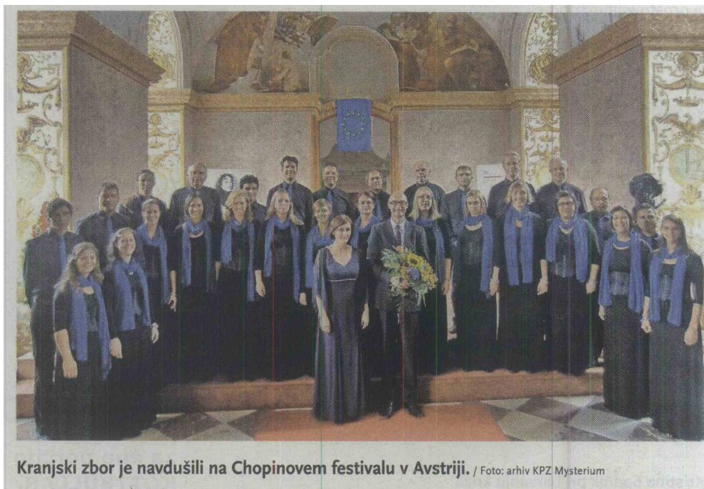
Kranjski zbor je navdušili na Chopinovem festivalu v Avstriji.

Mysterium se je pod vodstvom zborovodje Gregorja