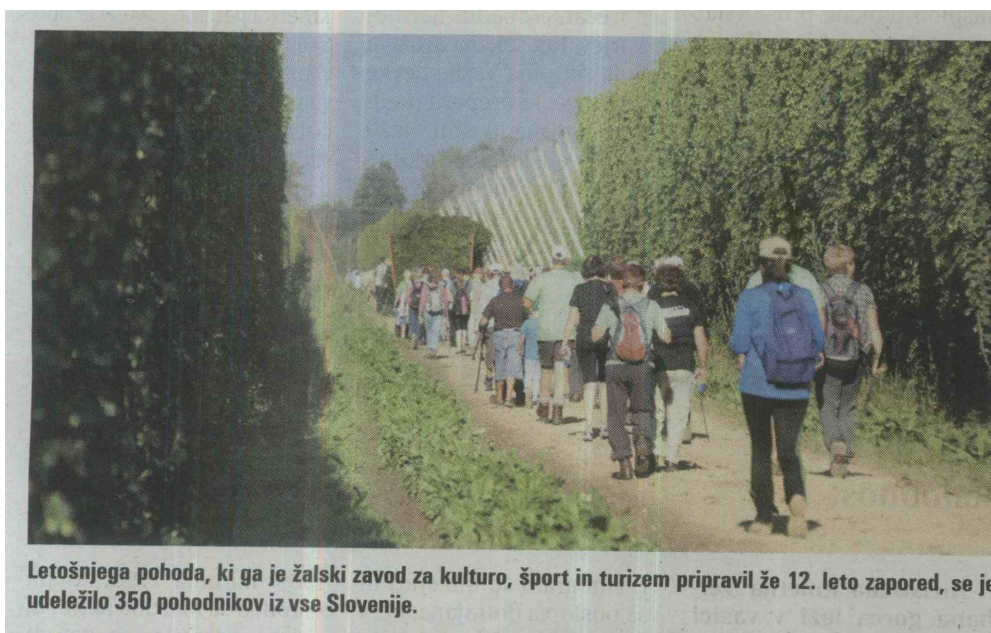
Letošnjega pohoda, ki ga je žalski zavod za kulturo, šport in turizem pripravil že 12. leto zapored, se je udeležilo 350 pohodnikov iz vse Slovenije.