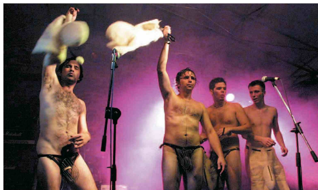
Navdih za kip je reška skupina Let 3, ki bo nastopila v klubu Jama. (Sašo Bizjak)