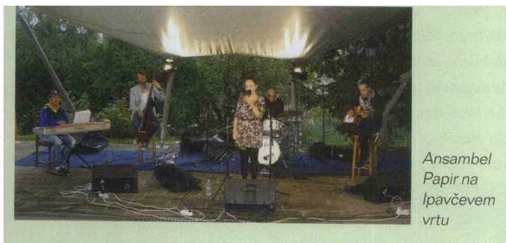
Ansambel Papir na Ipavčevem vrtu