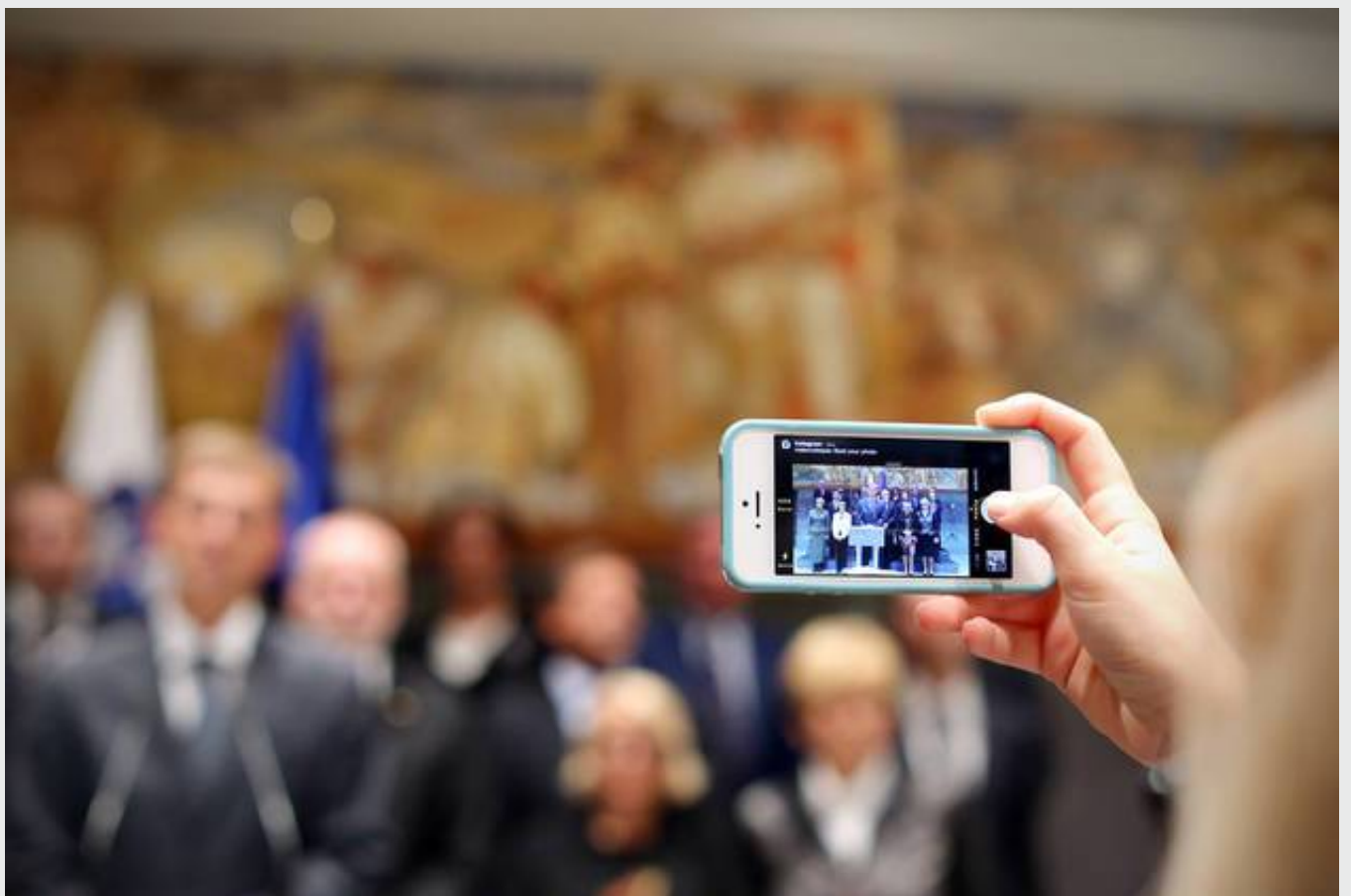
O kadrovski politiki vlade Mira Cerarja še ni mogoče govoriti.

nova vlada , kadrovanje , državni sekretarji