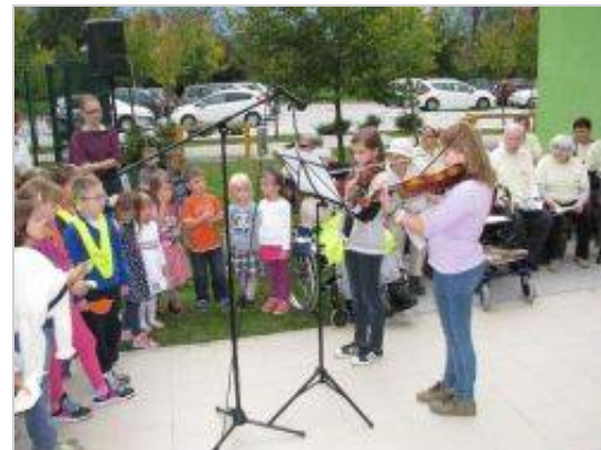
Na prireditvi so nastopili tudi otroci Glasbene šole Ribnica.

Golobčki miru iz papirja, na katere so udeleženci zapisovali svoje želje za mir na svetu, so bili le delček v pestrem dogajanju pri Domu starejših občanov Ribnica, kjer so ob kulturnem dogajanju zasadili tudi drevo miru. Jablana, mi so jo zasadili, je bila po češnji, višnji in marelici, ki so jih zasadili v preteklih treh letih, že četrto drevo miru, že na prireditvi pa so povedali, da bodo prihodnje leto zasadili hruško. Za posaditev novega drevesa miru pa bodo tudi prihodnje leto organizirali prireditev, ki se je je letos udeležilo množstvo ribniških otrok, pa tudi lepo število stanovalcev Doma starejših občanov Ribnica.