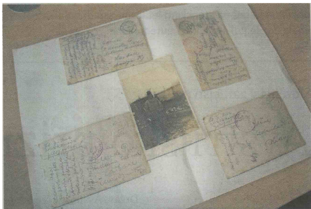
Fotografije, ki jih je kot razglednice podjetnik Franjo Sirc pošiljal svoji zaročenki Zdenki Pirc.