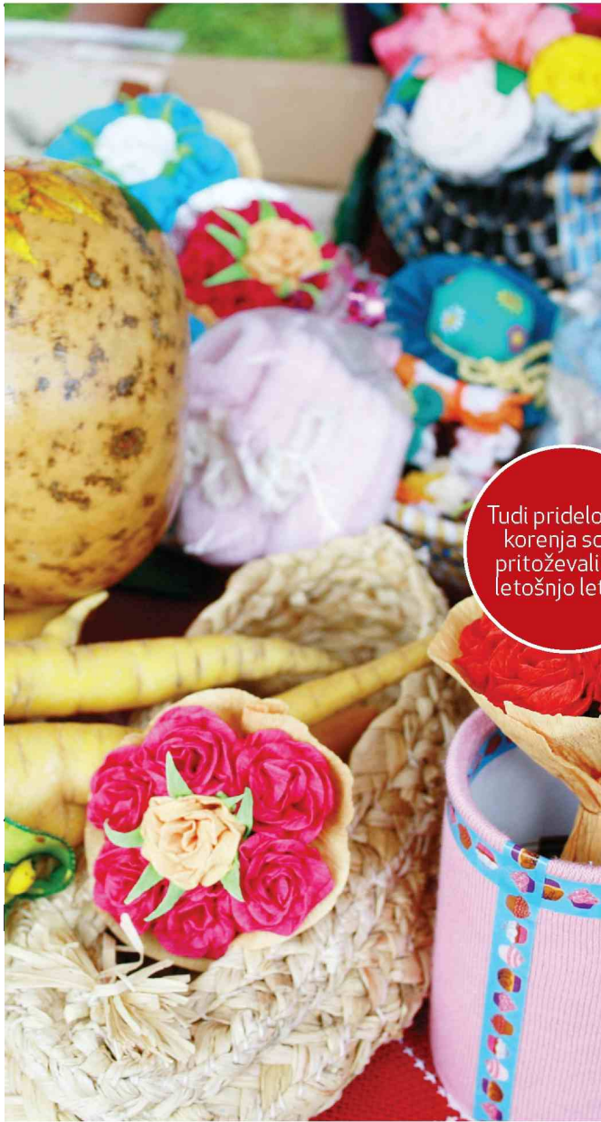
Tudi pridelovalci korenja so se pritoževali nad letošnjo letino.