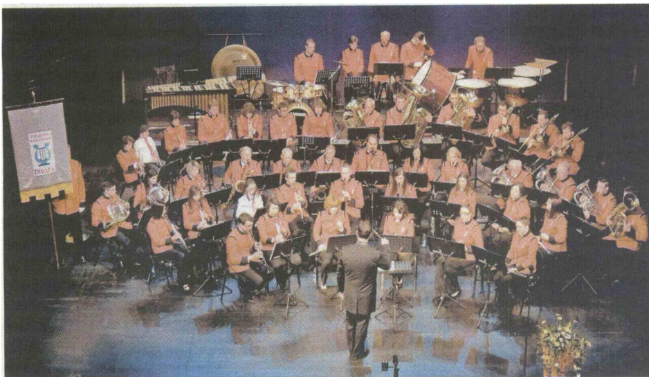
Pihalni orkester Divača je svojo 60-letnico obeležil s slavnostnim koncertom v Kosovelovem domu.