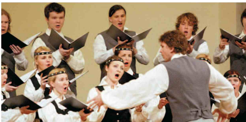
8. mednarodno zborovsko tekmovanje, zbor latvijske Akademije za glasbo (Sašo Bizjak)

13. Mednarodno zborovsko tekmovanje Maribor bodo odprli v petek ob 19. uri z netekmovalnim koncertom, na katerem bodo zbori predstavili