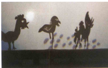
Senčne lutke OŠ Ob Dravinji.

Vse predstave so si brezplačno ogledali otroci vrtca Žiče in učenci OŠ Žiče. (B. S.)