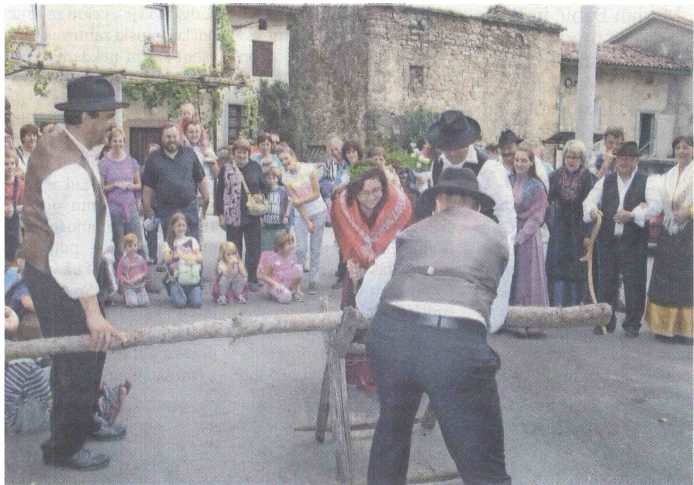
Podpora občine je ključna za nadaljevanje pester kulturne ponudbe in ohranjanje izročila.