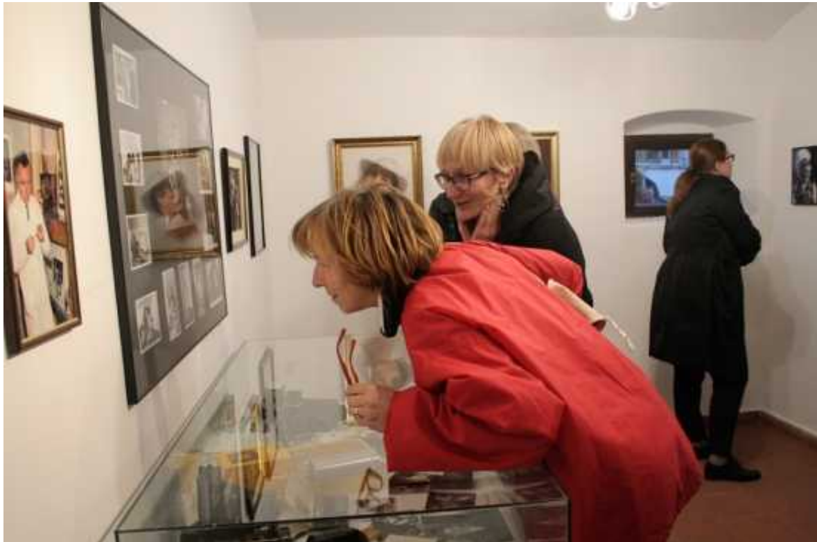
Razstava je razdeljena na dva dela in dve prizorišči.