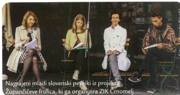
Nagrajeni mladi slovenski pesniki iz projekta Župančičeve frulice, ki ga organizira ZIK Crnomelj