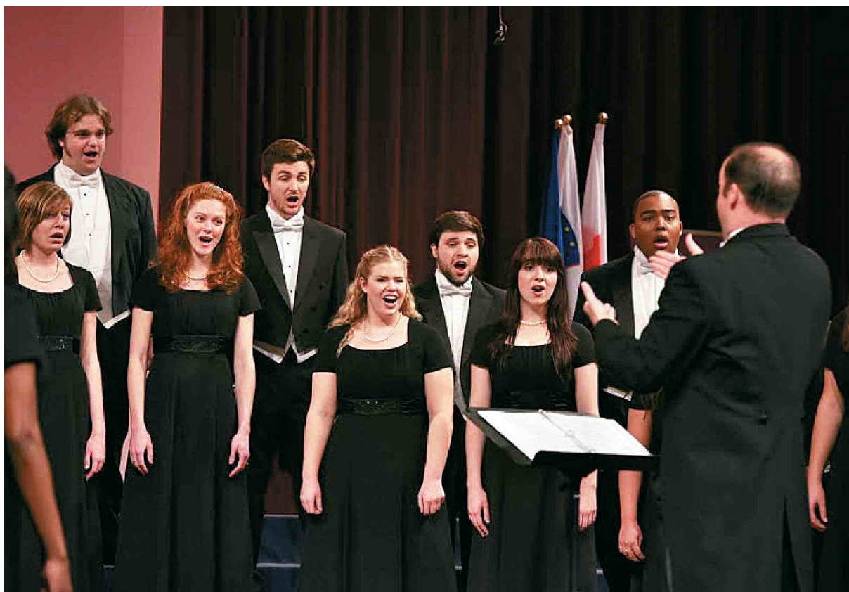
Zbor, ki je najbolj prepričal žirijo