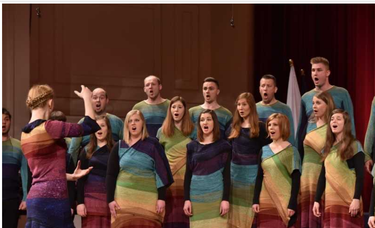
Akademski pevski zbor Maribor je prejel nagrado občinstva.