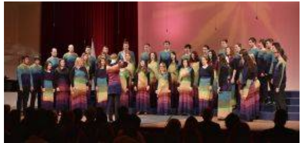
V Mariboru so se letos predstavili vrhunski zbori iz Indonezije, Irske, Latvije, Nemčije, Švedske, Slovenije in prvič tudi iz ZDA.