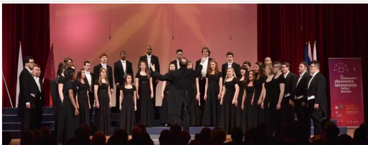
Zmagovalni zbor East Carolina University Chamber Singers

Komorni zbor Univerze vzhodne Karoline iz ZDA je zmagal na mednarodnem zborovskem tekmovanju , ki je potekal v Mariboru.