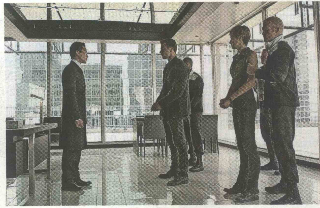
Iz filma Trilogija razcepljeni: Neupogljivi

Kobarid; OPZ Tolmin; PŠ Volče; MPZ OŠ Most na Soči; OPZ OŠ Tolmin; MPZ OŠ Kobarid in MPZ OŠ Tolmin. Strokovna spremljevalka Revije je Marinka Šuštar.