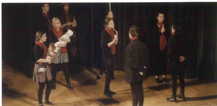
Simpatični dijaki in člani Gimnazije Slovenske Konjice ter Kulturnega društva svoboda osvobaja so zbrane nasmejali z ostro in kritično komedijo Norci iz Helma.