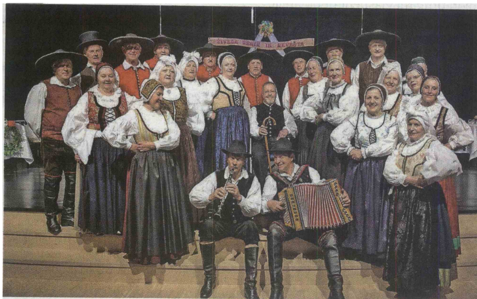
Kulturno društva Folklor Cerklje praznuje desetletnico folklorne dejavnosti.

Ideja za medgeneracijski projekt se je porodila