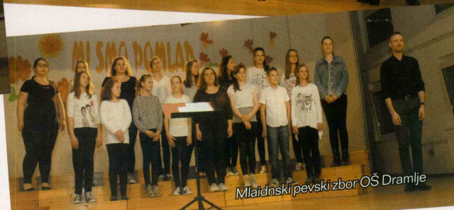
Mladinski pevski zbor OŠ Dramlje