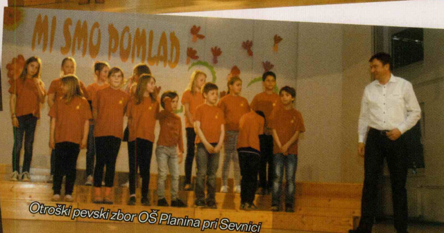
Otroški pevski zbor OŠ Planina pri Sevnici