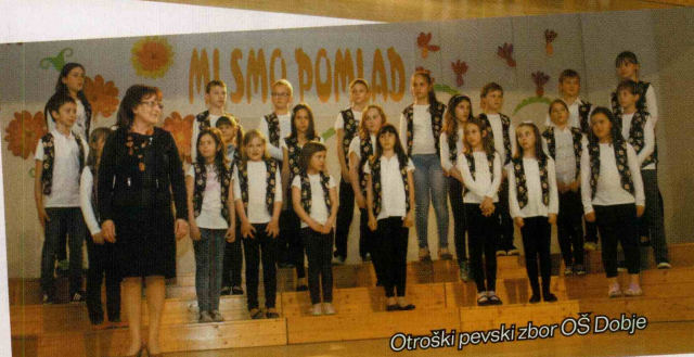
Otroški pevski zbor OŠ Dobje