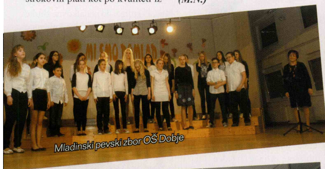
Mladinski pevski zbor OŠ Dobje