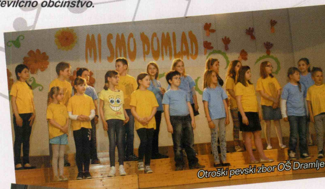
Otroški pevski zbor OŠ Dramlje

vedbe zadoščala kriterijem razpisa za nastop na reviji, ki pomeni vrhunc koncertnega programa vsakega zbora. Lahko rečem, da so zbori dobro, dostojno odpeli svoje programe. Tisti, ki se pripravljajo za nadaljnje nastope in gostovanja, so bili morda za nianso bolj uigrani, vsi ostali pa še imajo čas, da do konca šolskega leta še izpilijo svoje nastope.“ Nastaja Močnik, predstavnica OI JSKD Šentjur, je pevkam in pevcem, ki zaradi konca šolanja v osnovnih šolah zaključujejo tudi s petjem v zborih, podelila priznanja sklada. (M.N.)