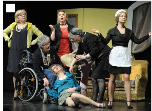
Predstavo 8 žensk je postavilo na oder Beneško gledališče (KM)