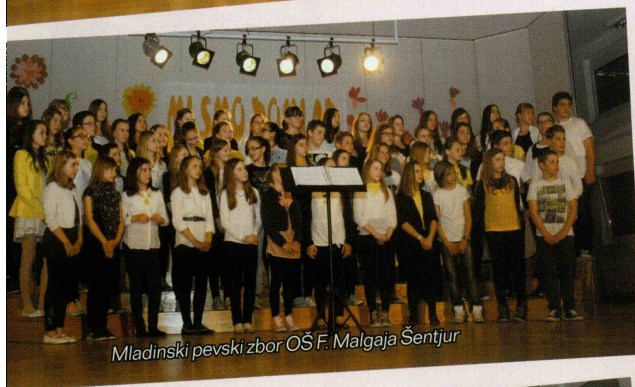
Mladinski pevski zbor OŠ F. Malgaja Šentjur