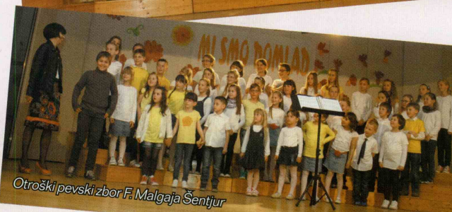
Otroški pevski zbor F. Malgaja Šentjur