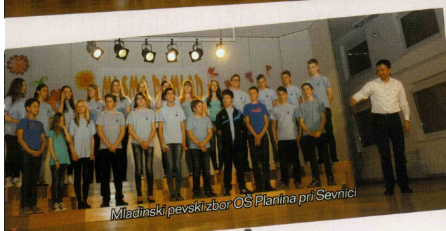
Mladinski pevski zbor OŠ Planina pri Sevnici