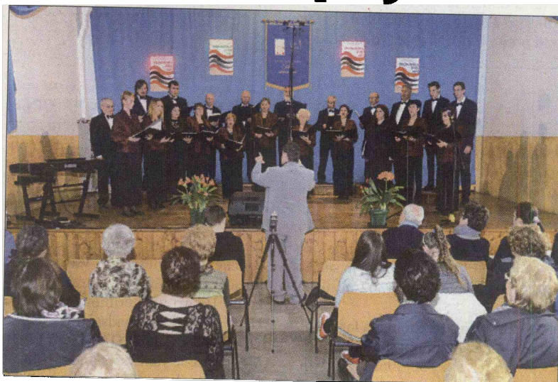
V domu Skala so zadonele zadnje note letošnje revije