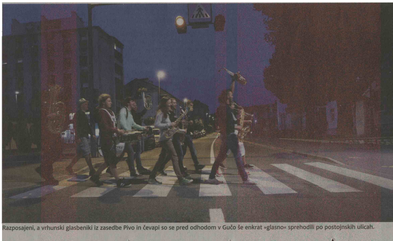
Razposajeni, a vrhunski glasbeniki iz zasedbe Pivo in čevapi so se pred odhodom v Gučo še enkrat »glasno« sprehodili po postojnskih ulicah.