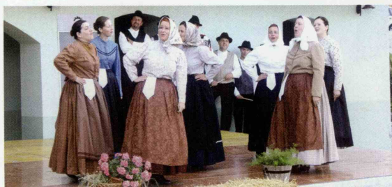
Člani folklorne skupine Jurovčan so ples popestrili z romantično pevsko igro.

Takole so atraktivno zaplesali člani Folklornega društva Šentjur.