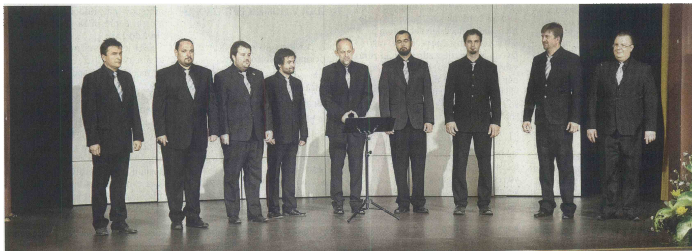
Ljutomerski oktet z lepo, največkrat slovensko ali ljudsko pesmijo sodeluje na marsikateri prireditvi.