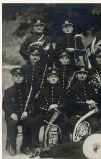
■ Rudarska godba v Trbovljah leta 1936