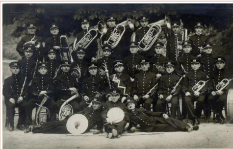
Rudarska godba v Trbovljah leta 1936

Danes v Sloveniji deluje okrog 150 amaterskih pihalnih godb. Zanje strokovno in organizacijsko skrbita Javni sklad Republike Slovenije za kulturne dejavnosti ter Zveza slovenskih godb. Okoli 50 pihalnih godb deluje tudi v okviru glasbenih šol in so sestavljene iz učencev igranja na pihala, trobila, tolkala in druge instrumente. Poleg ljubiteljskih v Sloveniji delujeta tudi dve profesionalni godbi na pihala. Leta 1948 je bila na