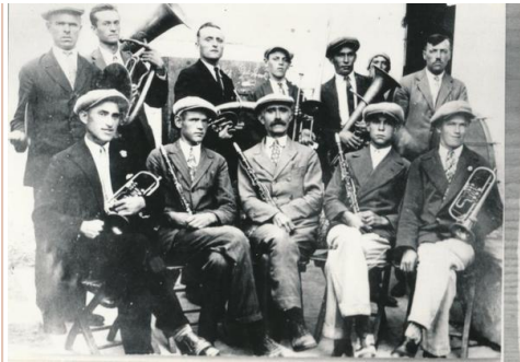
Godbeniki v Kortah leta 1923

Drugi glasbeniki, ki so pomembno pripomogli k razvoju godb, so bili tako imenovani mestni piskači, protokolarni glasbeniki, ki so si od srednjega veka do 19. stoletja tu in tam služili denar tudi z igranjem na »neobveznih« zabavnih in ceremonialnih prireditvah mestnih skupnosti. Po tretji strani imajo godbe na pihala tudi povsem »ljudske« korenine, saj so jih vselej sestavljali tudi samouki glasbeniki, ljudski godci, ki so se združevali ob različnih priložnostih ter v muziciranje vnašali svoje znanje in elemente ljudske glasbene estetike.