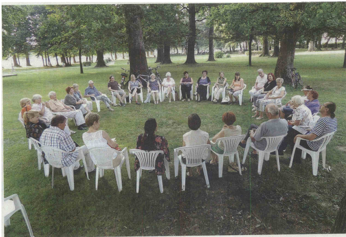
Veliko obiskovalcev je v Ljutomeru na Dnevu kulture uživalo ob poeziji, glasbi in lepi besedi ter žlahtni kapljici.