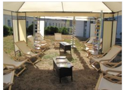
Poletna bralnica v Parku Rastoča knjiga Novo mesto

Poletni delovni čas Knjižnice Mirana Jarca Novo mesto: do 29. avgusta vas od ponedeljka do torika pričakujemo med 11. in 19. uro, v sredo, četrtek in petek pa med 8. in 16. uro. Ob sobotah je knjižnica zaprta.